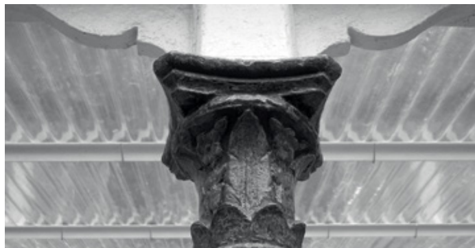
Het verleden is een beproefd bouwwerk van zoveel fouten en nog meer gebreken. Torsend tegelijk met verve wat nog komen moet, vandaag, morgen, overmorgen.

Het ADVN is een archief-, documentatie- en onderzoekscentrum. Vanuit een open maatschappelijke geest en gesteund op een wetenschappelijke methodologie, verzamelt, bewaart en beheert het ADVN het erfgoed over de Vlaamse beweging in haar brede historische en thematische context. Tot de brede context van dit veiliggestelde erfgoed behoren de nationale bewegingen als maatschappelijk-filosofisch verschijnsel, inbegrepen de thema's die daarmee zijn verbonden of ervan afgeleid zijn (zoals culturele identiteit, natievorming, migratieprocessen, nieuwe sociale bewegingen).