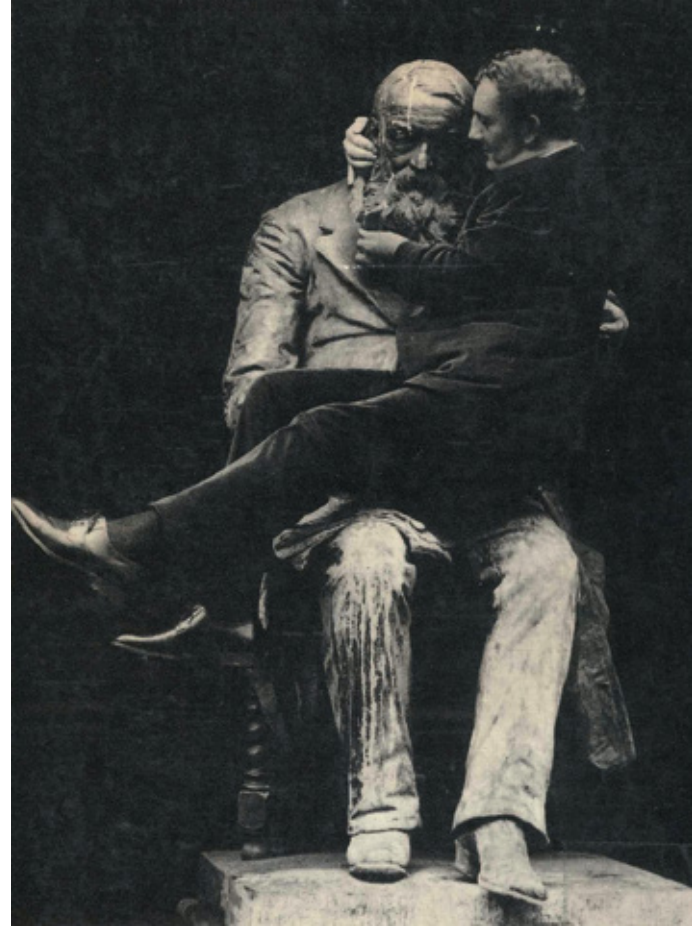
Hugo Claus in innige omhelzing met het bronzen beeld van Hendrik Conscience. Achterplaat van Het goudland, spel van Hugo Claus naar Hendrik Conscience (De Bezige Bij, 1966).