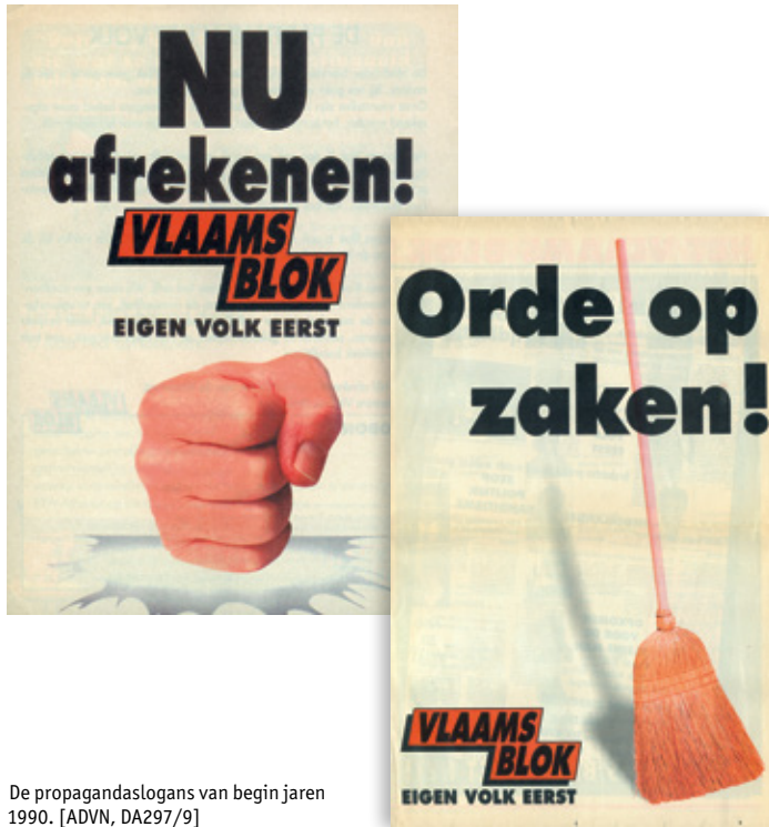
De propagandaslogans van begin jaren 1990. [ADV, DA297/9]

parlementsverkiezingen van 1987 scoorde de partij wat beter: de jongeren Gerolf Annemans en Filip Dewinter veroverden een zetel in de Kamer, terwijl Karel Dillen naar de Senaat verhuisde. In dat jaar sloopte de partij ook de Vlaamse vleugel van het RAD op. De wetgevende verkiezingen van 24 november 1991 zorgden voor een eerste doorbraak. Ruim 400 000 kiezers stuurden twaalf VB-volksvertegenwoordigers naar het parlement, terwijl de Senaat zes partijgenoten telde. Vier jaar later dreef het Vlaams Blok zijn stemmenaantal op tot ruim 475 000, goed voor elf kamerleden; in de Senaat zetelden vijf VB'ers. Zeventien VB-leden werden lid van het eerste Vlaams Parlement, terwijl in de Brusselse Hoofdstedelijke Raad twee VB'ers zetelden.