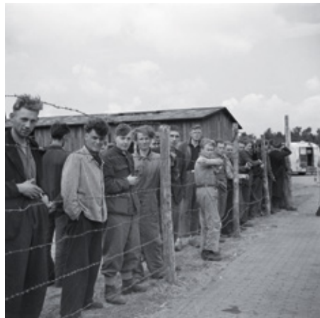
Gearresteerde SS'ers en Landwachters in het Nederlandse interneringskamp De Harskamp in juni 1945.

Toen er in 1944 en 1945 een einde aan de Duitse bezetting van België en Nederland kwam, leek het vanzelfsprekend dat alle 'landverraders' uit de samenlevingen zouden worden verwijderd. Enkele honderdduizenden mensen werden opgepakt en