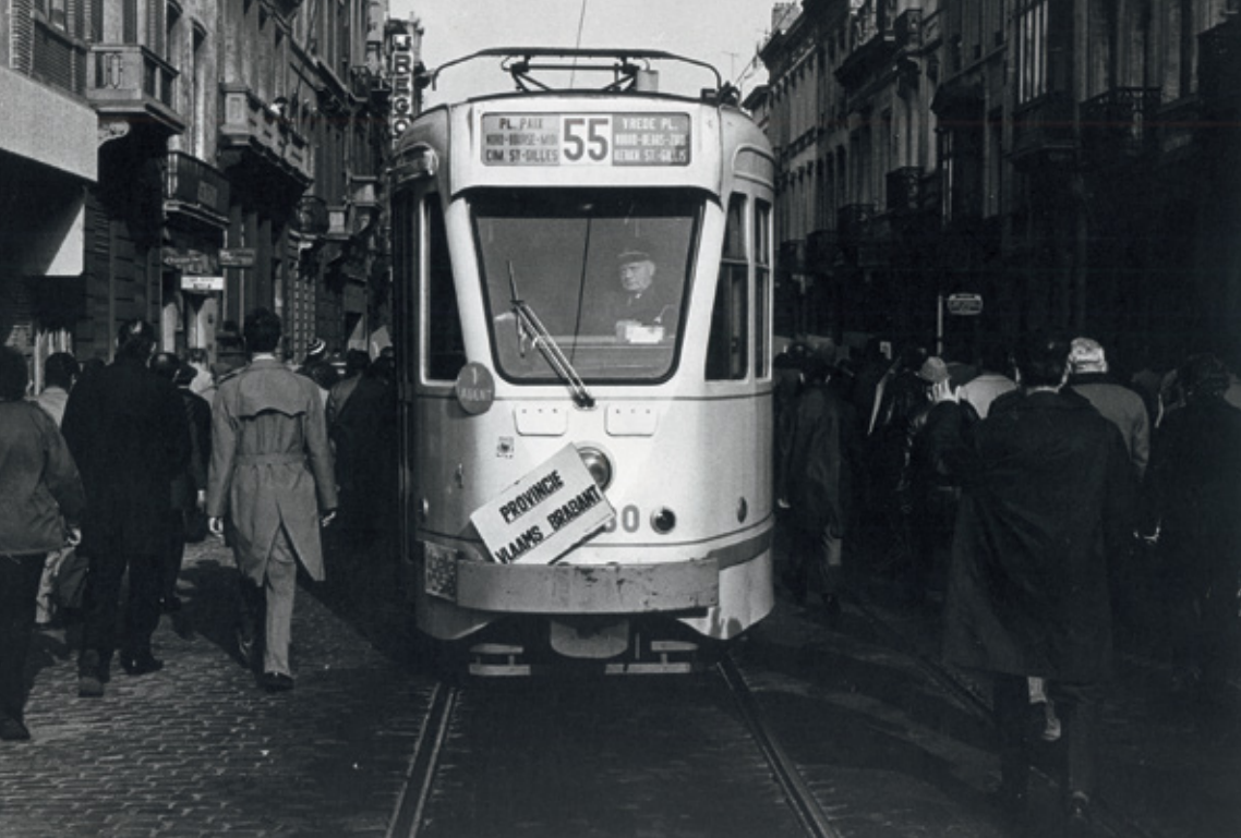
Betoging in Brussel, s.d.

Nieuw-Vlaamse Alliantie (N-VA) en SPIRIT. Niet veel later, op 21 december 2001, rolde het laatste nummer van Wij van de pers. Het fotoarchief werd in het voorjaar van 2010 aan het ADVN overgedragen en maakt deel uit van het archief van de Volksunie (BE ADVN AC54). Vandaag vormt deze fotocollectie een bevoorrechte getuige die een Vlaams verleden illustreert. [rc]