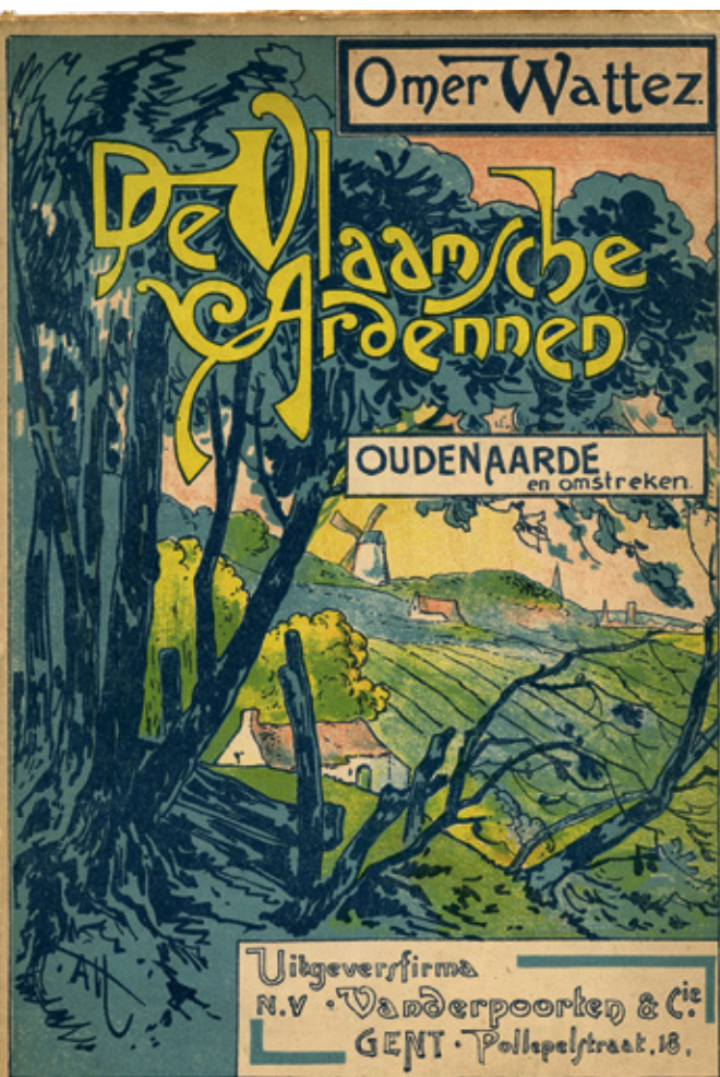
Cover van Omer Watzte, De Vlaamse Ardennen , Gent, 1926.

De banbliksems die Claus uitsprekt over de Vlaamse maatschappij zijn eigenlijk niet geheel nieuw in de Vlaamse literatuur. Zij herinneren ons integendeel aan de denigrerende uitspraken die op het einde van de 19de en in het begin van de 20ste eeuw