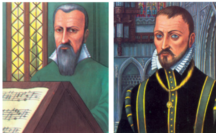
Adriaan Willaert en Orlandus Lassus.

(4) Openingsvers van Vader (Melopeeprijs, Laarne, 2013), in: Het Liegend Konijn , jg. 10, 2012, nr. 1.