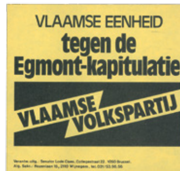
Het ongenoegen van de Vlaamse Volkspartij omtrent het Egmontpact, s.d. [ADV, VPP168]

Zowel bij de wetgevende verkiezingen van 1978 als die van 1981 en van 1985 bleef het Vlaams Blok hangen op één zetel in de Kamer van Volksvertegenwoordigers. Pas bij de