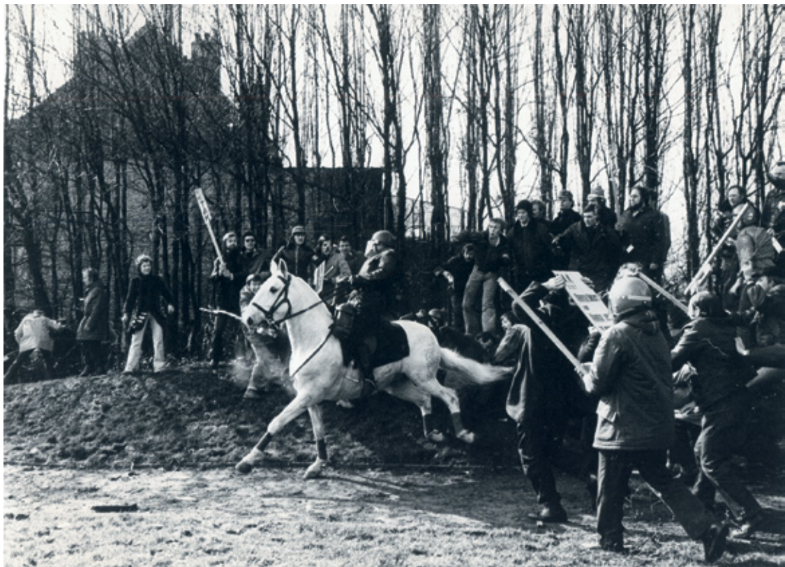
TAK-manifestatie, 16 maart 1975.

Dat de geschiedenis van Wij onlosmakelijk verbonden is met die van de Volksunie, daarvan getuigt ook de stopzetting van het weekblad. De partij viel in oktober 2001 uit elkaar in twee nieuwe partijen: de