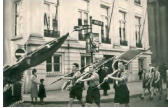
Vaandeldragers tijdens een AVNJ-optocht in Antwerpen [jaren 1930].

Tot aan de Eerste Wereldoorlog was het vooral de Vlaamse katholieke studentenbeweging, met als koepels de Vlaamsche Studentenbond (1877), het Katholiek Vlaamsch Studentenverbond (1890) en het Algemeen Katholiek Vlaamsch Studentenverbond (AKVS) (1903), die de meeste jongeren rond zich wist te verzamelen. Maar ook initiatieven in de buurlanden vonden hun weg naar Vlaanderen. De invloed van de Duitse Wandervogelbeweging en de padvinderij (scouting) van luitenant-generaal Baden Powell in Engeland hebben evenzeer bijgedragen tot de ontwikkeling van de jeugdbewegingen in Vlaanderen.