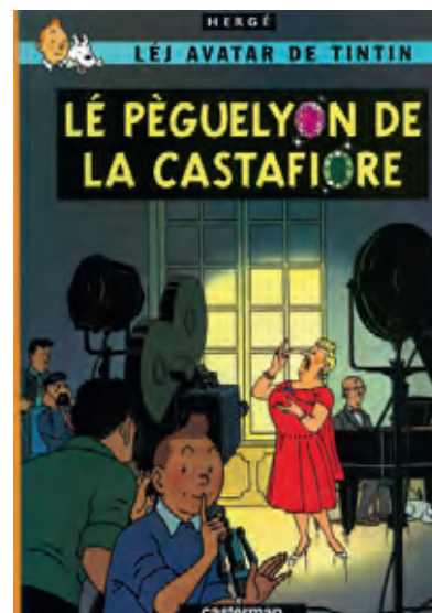
Het Kuifje-album De Juwelen van Bianca Castafiore werd in 2006 door Casterman in het francoprovençal of arpitain bressan uitgegeven. © Hergé/Moulinart 2009

(5) Die Welt , donderdag 30 oktober 2008, p. 6.