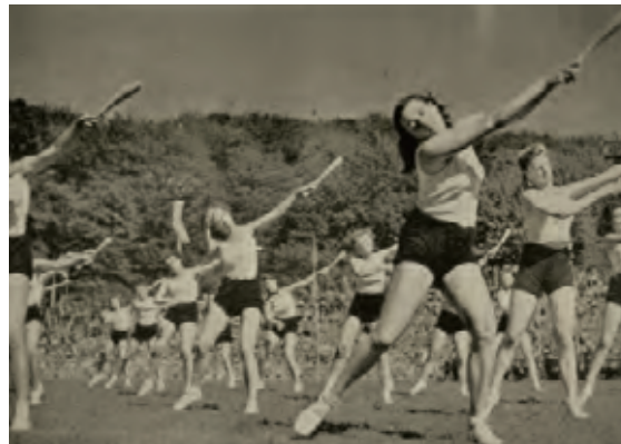
Dietsche Meisjesscharen (DMS), s.d. [ADV N, VLB26/4]

Onder impuls van de Katholieke Actie werd in 1928 ook het Jeugdverbond voor Katholieke Actie (JVKA) opgericht, die de vele al bestaande katholieke organisaties, zoals de Katholieke Arbeidersjeugd (KAJ) en KSA, opnieuw ging overkoepelen. In deze periode moet ook het ontstaan