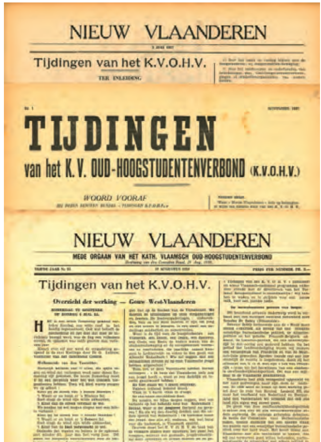
De eerste Tijdingen van het KVOHV verschenen vanaf juli 1937 in het weekblad Nieuw Vlaanderen . Voor niet-abonnees werden deze berichten tot augustus 1939 driemaandelijks in een bundel onder dezelfde titel uitgegeven. Vanaf dan kreeg de achterzijde van Nieuw-Vlaanderen de ondertitel Mede Orgaan van het Katholiek Vlaamsch Oud-Hoogstudentenverbond . [ADV.N, VY900073 en VY900000]

Het Katholiek Vlaamsch Oud-Hoogstudentenverbond (KVOHV) behoort tot de traditie van oud-hoogstudentenbonden waarvan de eerste in 1886 van start ging. Zo werd onder impuls van Emiel De Visschere in december 1886 de Oud-Hoogstudentenbond van West-Vlaanderen opgericht. In navolging van West-Vlaanderen werden er ook oud-hoogstudentenbonden opgericht in de vier andere Vlaamse provincies. Samen bleezen ze in 1907 de voormalige Vlaamse Katholieke Landsbond nieuw leven in onder de naam Katholieke Vlaamse Landsbond (KVL). Het voornaamste strijdpunt van de oud-hoogstudentenbonden was de ver-nederlandsing van het onderwijs en van de Gentse universiteit. Wegens de oorlog en de deelname aan het activisme van tal van vooraanstaanden hielden de meeste bonden na 1918 op te bestaan. Reeds vanaf 1924-1925 werden naar aanleiding van de Leuvense studentenrevolte, nieuwe oud-hoogstudentenbonden opgericht in Antwerpen, Oost- en West-Vlaanderen. Zij kwamen evenwel nooit tot een krachtenbundeling, terwijl de naoorlogse KVL onder de leiding van Frans Van Cauwelaert een veel bredere beweging was geworden. De afwezigheid van een actieve oud-hoogstudentenbond bleef niet onopgemerkt voor het Katholiek Vlaams Hoogstudentenverbond (KVHV). Voorzitter Piet Meuwissen richtte in 1933 de Oud-Studentenbond