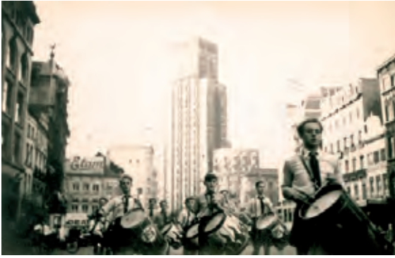
AVNJ-optocht langs de Meir in Antwerpen [jaren 1930]. [ADV N, VFA1034]