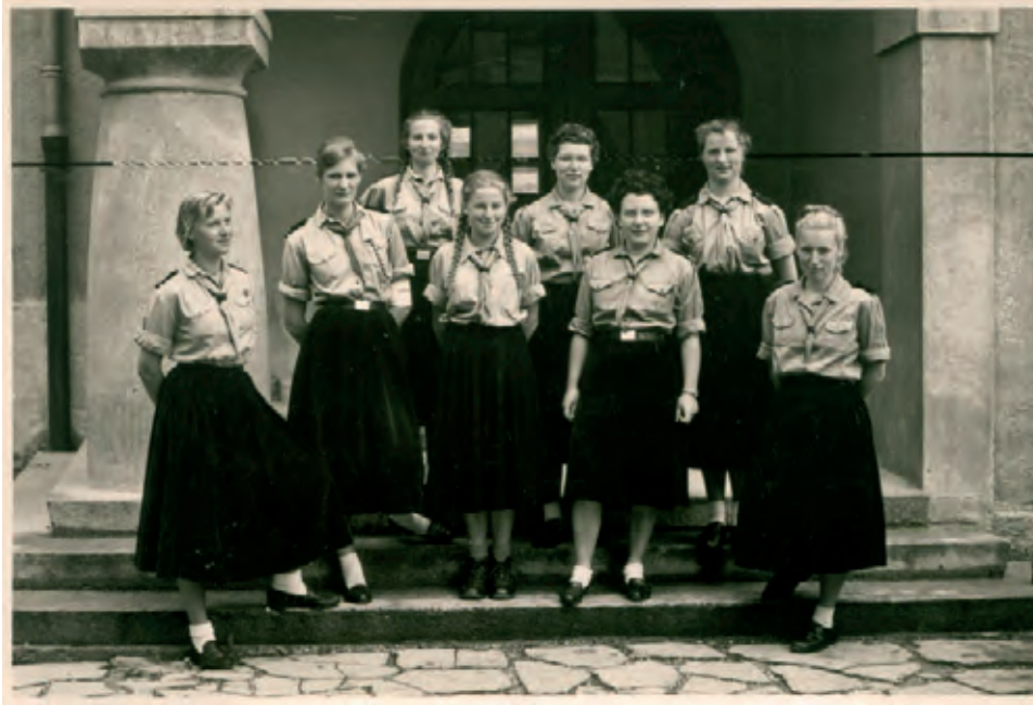
8 Groep meisjes van het Blauwvoetjeugdverbond (BJV) in Solbad Hall, Tirol (Oostenrijk) tijdens een Verschaeve-herdenking [25 juli 1958]. [ADV.N, VFA8535]

jongens- en meisjesafdeling hun werking verder met een eigen leiding.