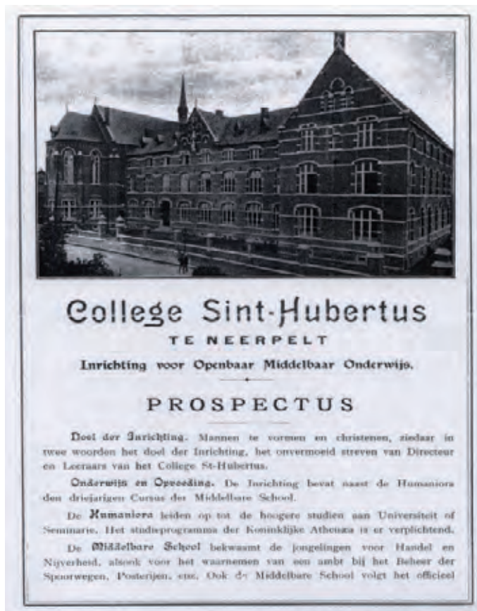
Cover van prospectus van het Sint-Hubertuscollege in Neerpelt, ca. 1914.

Nieuwe abonnees ontvangen gratis het bijzondere Wt -nummer 2001/4 met daarin de bibliografie van Wetenschappelijke tijdingen (selectieve bibliografie 1935-1979, volledige bibliografie 1980-2000).