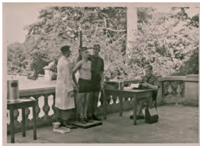
Een leerling van de NSJV-kaderschool (Vilvoorde) wordt gemeten buiten op de bordes van het kasteel Orban, s.d.