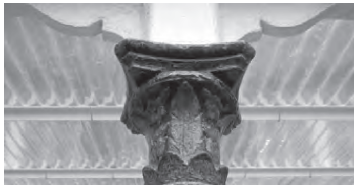
Het verleden is een beproefd bouwwerk van zoveel fouten en nog meer gebreken. Torsend tegelijk met verve wat nog komen moet, vandaag, morgen, overmorgen.

Het ADVN is een archief-, documentatie- en onderzoekscentrum. Vanuit een open maatschappelijke geest en gesteund op een wetenschappelijke methodologie, verzamelt, bewaart en beheert het ADVN het erfgoed over de Vlaamse beweging in haar brede historische en thematische context. Tot de brede context van dit veiliggestelde erfgoed behoren de nationale bewegingen als maatschappelijk-filosofisch verschijnsel, inbegrepen de thema's die daarmee zijn verbonden of ervan afgeleid zijn (zoals culturele identiteit, migratieprocessen, nieuwe sociale bewegingen).