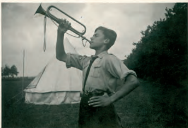
Klaroerblazer. Dietse Blauwvoetvondels (DBV) op kamp, s.d. [ADVN, VFA973]

beleven van de godsdienst in plaats van het onderricht ervan. Van al deze groepen ontptopten vooral de KSA en de Chirojeugd zich tot populaire Vlaamsgezinde jeugdbewegingen.