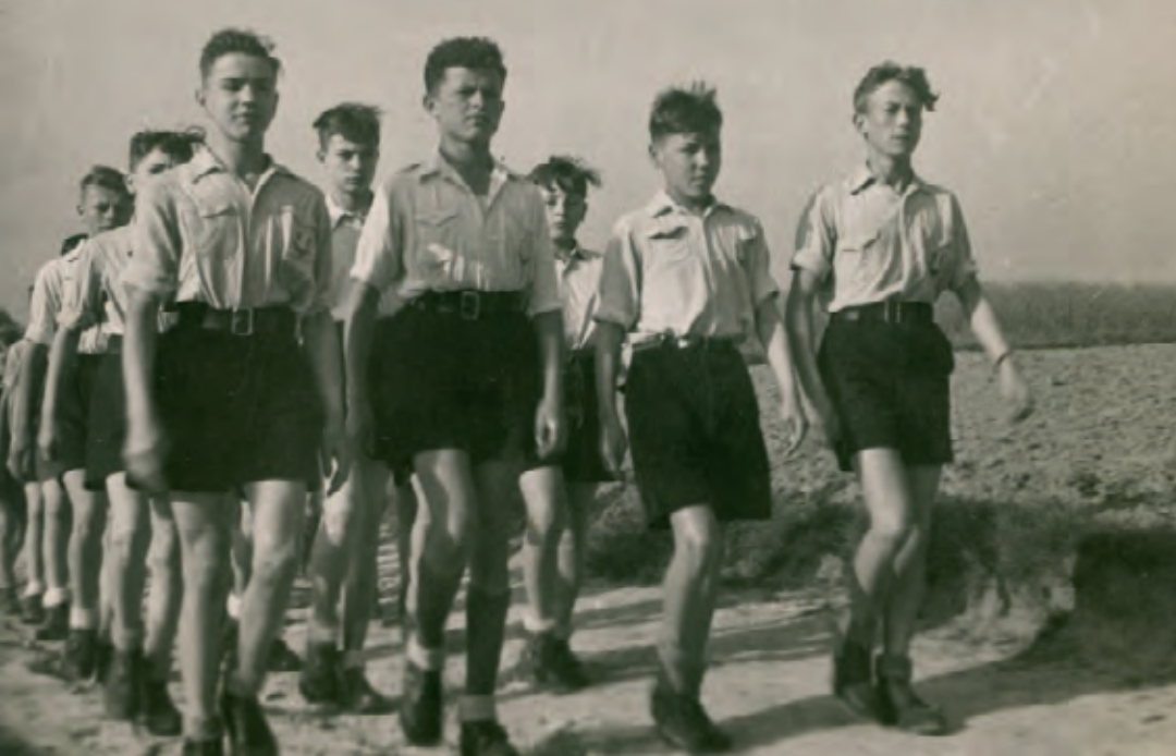
Marcherende leden van De Zilvermewuwtjes, s.d.

het ledenaantal. In 1950 telde de katholieke jeugdbeweging nog net geen 80 000 leden, vijftienvintig jaar later waren er maar liefst 222 000 jongeren aangesloten. In de tweede helft van de jaren 1970 kende het ledenaantal een algemene terugval. Hierdoor ging men op zoek naar een nieuwe formule die onder meer werd gevonden in het mengen van de tot dan afzonderlijke jongens- en meisjesafdelingen en het afwijzen van een autoritaire aanpak. Het is ook in deze periode dat het verdwijnen van de traditionele Vlaamsgezindheid bij de grote jeugdbewegingen in gang werd gezet.