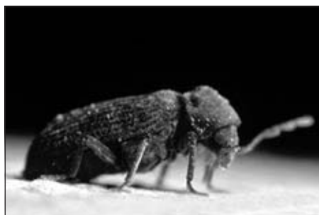
De Gewone Houtworm.

Kevers zijn insecten met een volledige metamorfose. Dat betekent dat ze vier ontwikkelingsstadia doorlopen: ei-larve-pop-imago. Voor ons hout zijn enkel de larven schadelijk. Zij vreten zich gedurende jaren een weg door het hout (sommige zoals de Huisboktor doen dat wel gedurende 15 jaar of meer). Wanneer de volwassen kever uit de pop kruipt, leeft hij meestal niet langer dan enkele weken en voedt zich dan – als hij zich al voedt – met stuifmeel. Hij heeft net genoeg tijd om een partner te vinden en weer nieuwe eitjes in een scheur van het hout te leggen.