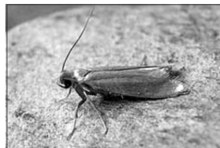
De Gewone Kleermot.

Onder “motten” verstaan we meestal de nachtvlinders die we niet associëren met de kleurrijke dagvlinders. Nochtans behoren zij beide tot de orde van de vlinders ( Lepidoptera ). Motten hebben vaak ook de reputatie lelijk of schadelijk te zijn en dat hebben ze gedeeltelijk te danken aan de kleermotten.