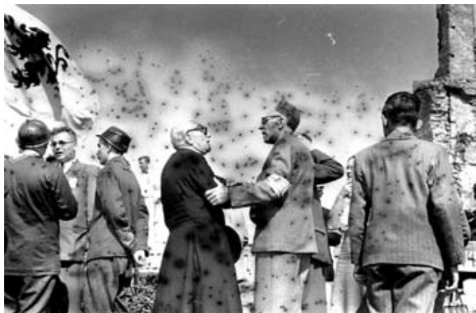
Twee afdrukken van dezelfde foto, waarvan de onderste aangetast is door een combinatie van schimmel en chemische verkleuring.

men de schimmel wil doden (dus niet alleen de groei wil stoppen), is gammastraling de enige methode. Van gammastralen is echter bekend dat ze de veroudering van het materiaal versnellen. Het is ook een heel dure methode omdat het buiten de bewaarplaats moet gebeuren.