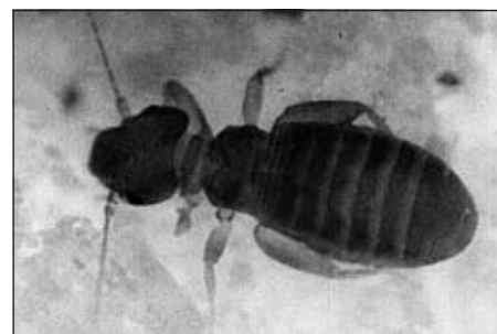
De Gewone Boekluis.