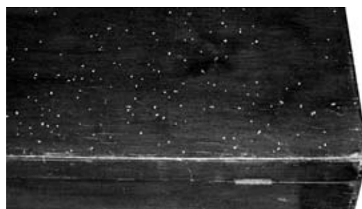
Houten koffertje aangetast door houtworm.

De meest voorkomende houtborende kever in ons land, en de schrik van musea en archieven, is de Gewone Houtworm (Anobium punctatum) of Doodskloppertje, ook wel “memel” genoemd. De larven vreten gedurende 2 à 4 jaar in het hout en eindigen hun vraatgang vóór de verpopping net onder het oppervlak. Wanneer de volwassen kever na enkele weken tevoorschijn komt, verlaat hij het hout langs een zogenaamd “vlieggat”. Dat zijn de karakteristieke ronde gaatjes in het hout. Daaraan zien we meestal pas (dus te laat) dat het hout is aangetast. De Gewone Hout-